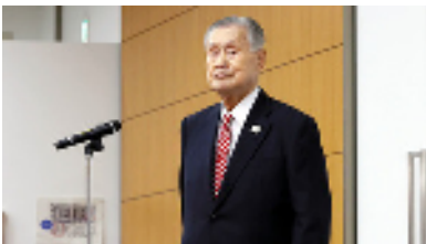
記者会見を終え、引き揚げる東京五輪・パラリンピック大会組織委員会の森喜朗会長=2021年2月4日、東京都中央区

東京オリンピック（五輪）・パラリンピック大会組織委員会の森喜朗会長(83)=元首相=が11日、女性蔑視発言をめぐり辞任の意向を固めたことがわかった。複数の関係者に同日、辞意を伝えた。後任は、日本サッカー協会や日本バスケットボール協会の会長を歴任し、東京五輪では選手村村長を務める川淵三郎氏(84)で調整している。