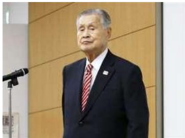
森会長発言 カナダのI O C委員「問い詰める」 批判的な反応続く

【ニューヨーク=上塚真由】東京五輪・パラリンピック組織委員会の森喜朗会長が「女性がたくさん入っている理事会は時間がかかる」などと発言したことに、海外では批判的な反応が続いている。