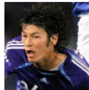
さようならオシムの申し子