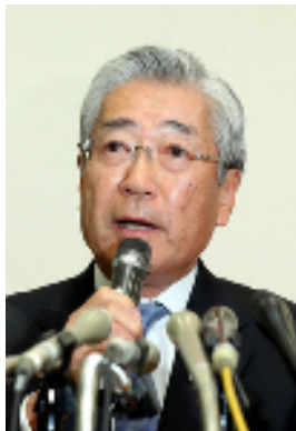
会見する日本オリンピック委員会の竹田恒和会長＝2019年1月15日午前11時、東京都渋谷区

※ご使用のブラウザや回線など、利用環境により再生できない場合があります。 ※現地の回線等の状況により、配信を一時中断または中止することがあります。