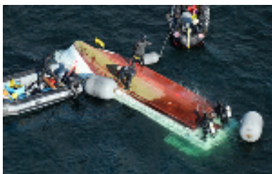
転覆した小型船「とびうお」の上で作業をする海上自衛隊員ら＝15日午前10時41分、広島県大竹市沖、朝日新聞社ヘリから、竹花徹朗撮影