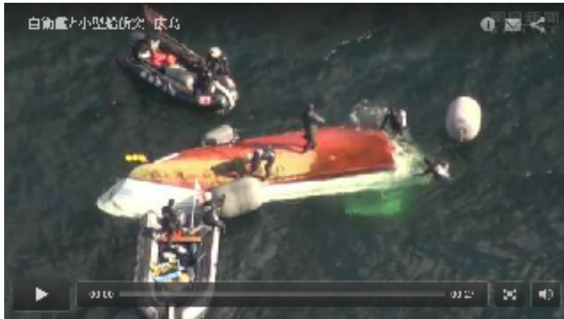
【動画】自衛艦と衝突、小型船が転覆