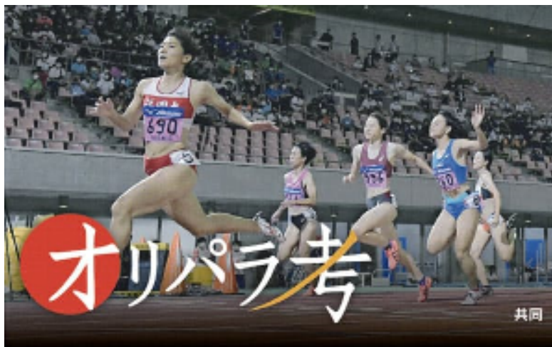
陸上の競技者は来年度から新たに日本陸連への「登録料」が必要になる（12日の日本学生対校陸上）

日本陸連は2021年度から新たに競技者の「登録料」を設定することを決めた。選手として活動するためには、大学生以上は1000円、中高校生は500円を毎年、所属先や居住地のある都道府県の陸上協会（地方陸協）を通じて新たに負担することになる。