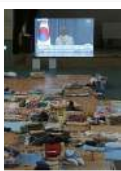
韓国・珍島の体育館で大型モニターに映し出される朴槿恵大統領=2014年5月19日

朴大統領は談話の最後に、友人を助けようと船室に戻って犠牲となった高校生や、最後まで避難誘導をして逃げられなかった乗務員らの名前を、涙を流しながら読み上げた。