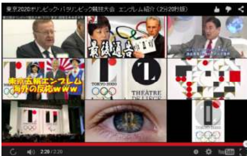
大会組織委員会によるエンブレム紹介動画

「東京2020オリンピック」のロゴマークが決定したが、一見すると当惑するようなデザインだ。